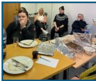
Frá fundi í heilsugæslunni í Miðbæ